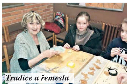
Tradice a řemesla