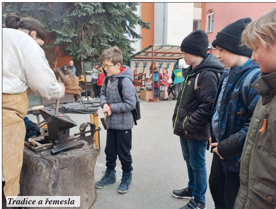
Tradice a řemesla

Dne 17. března 2023 se v Domě kultury Vizovice uskutečnila krásná akce „Tradice, řemesla a život na Valašsku“, jejímž cílem bylo představit nejen žákům základních škol z širokého okolí, ale také veřejnosti, jak se zde na Valašsku žilo, bydlelo a jaké tradice se dochovaly. Žáci 4. a 5. ročníku si tak mohli vyzkoušet s tesaři a kováři, jak se dřívě vyrábělo ze dřeva a kovu. Formou kreativních dílniček se seznamovali s tradiční řemeslnou výrobou zaměřenou na tradice, například s výrobou vizovického pečiva, dekorováním velikonočních kraslic nebo drátenictvím. Poznávali i další obory jako je stavař, elektrikář, stolař, fotograf, obuvník, oděvník. Na všech stanovištích žákům radili opravdoví mistři v oboru, lidoví řemeslníci, zástupci učilišť i odborných škol. Drobné výrobky si žáci odnesli domů. Akce proběhla za podpory MAS Vizovicko-Slušovicko.