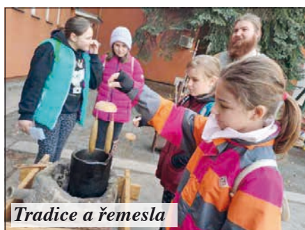
Tradice a řemesla