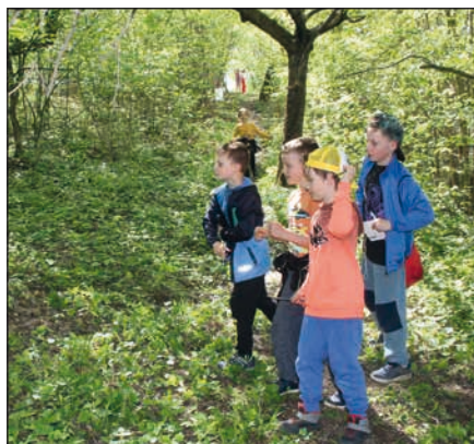
O nalezené drobnosti a sladkosti se rozdělili.

V pátek 5. května jsme uspořádali pro žáky navštěvující školní družinu čarodějnickou stezku. Trasa se čtrnácti stanovišti vedla rozkvetlou přírodou s cílem na nedalekém kopci. Žáci vycházeli po tříčlenných skupinkách a desetiminutových intervalech. Vzájemně spolupracovali při plnění úkolů. Na jednotlivých stanovištích zjistili vždy jedno písmenko z tajenky. Závěrem vyluštili tajenku – název pro pálení čarodějnic – Filipojakubská noc. Všichni pak společně hledali ukrytý poklad v lese.