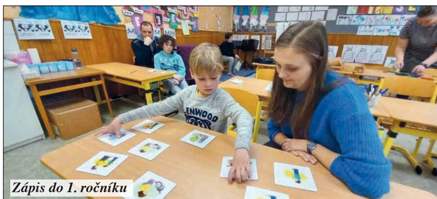
Zápis do 1. ročníku