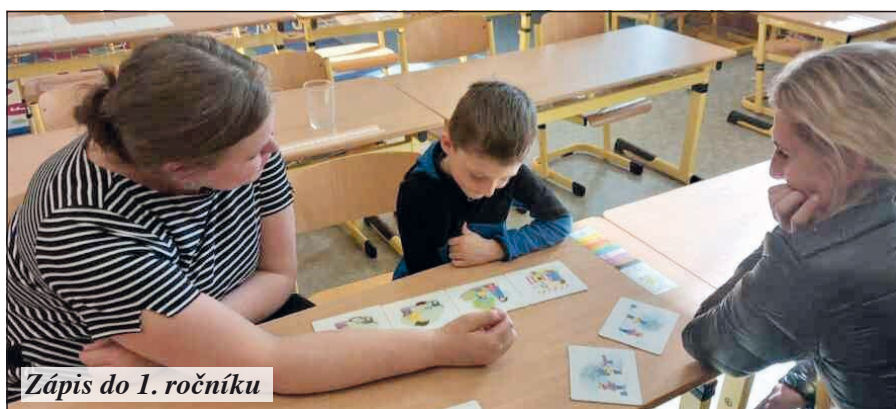
Zápis do 1. ročníku