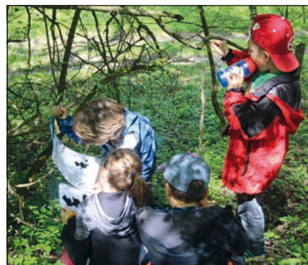
Odpoledne zalité sluncem, krásnou přírodou a poznáváním dávných zvyků se nám vydařilo.