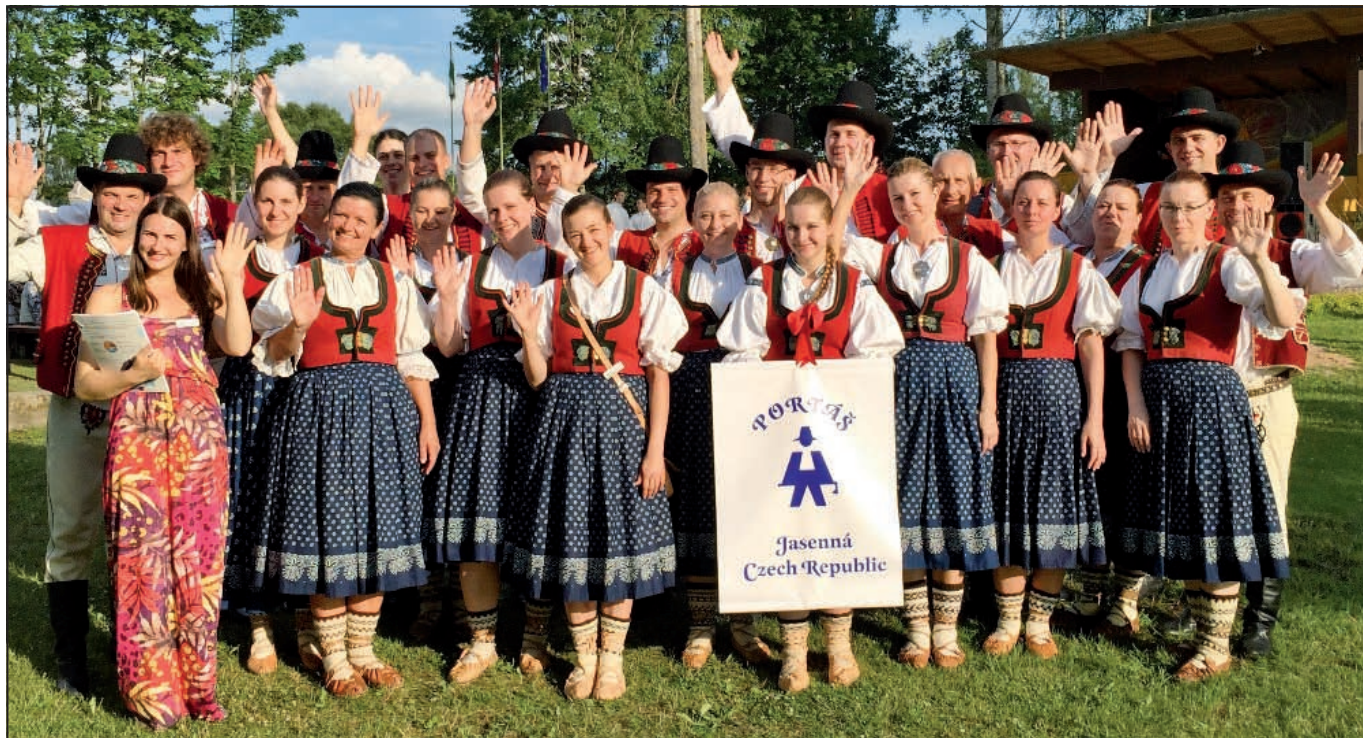
Valašský soubor Portáš po přehlídce v Lotyšsku.