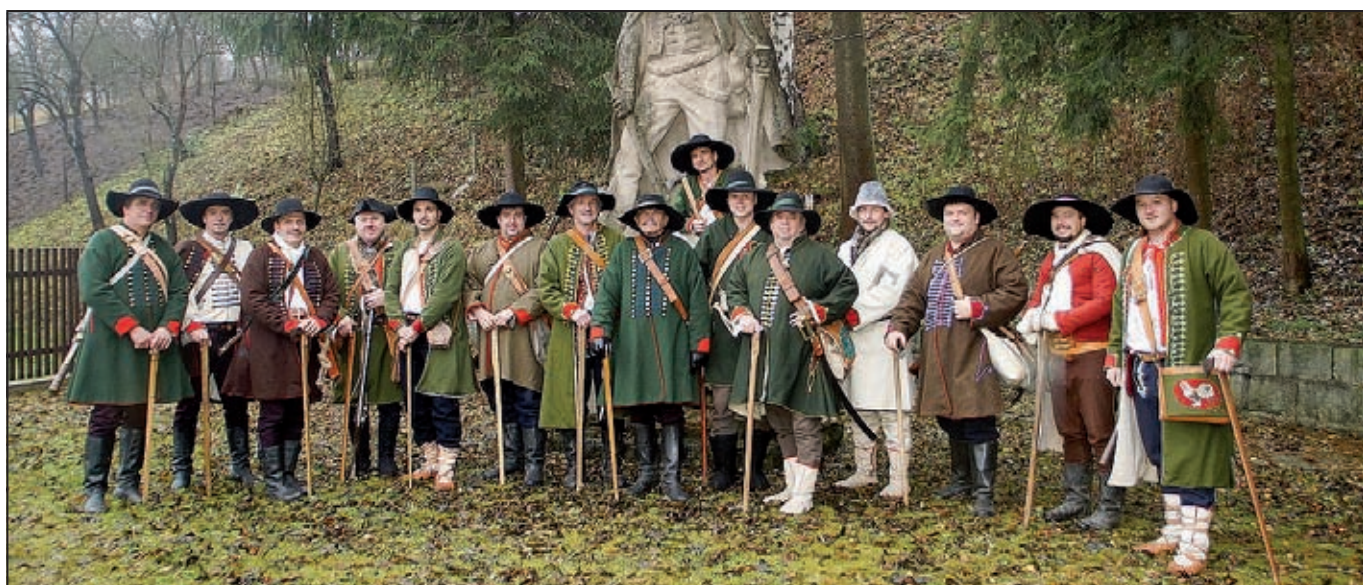
Valašský sbor portášský při výročním sezení v Jasenné dne 17. 11. 2016

Jasenský zpravodaj vydává OÚ Jasenná. IČ: 00284017. Vydáváno čtvrtletně nákladem 390 ks. MK ČR E 10674. Sazba: Studio-mk, Vsetín. Texty neprocházejí jazykovou úpravou. Toto číslo bylo vydáno dne 21. prosince 2016.