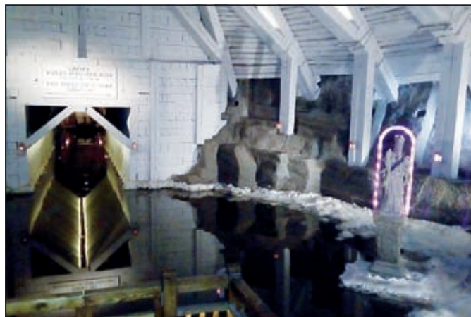
Solný důl Wieliczka, Polsko.