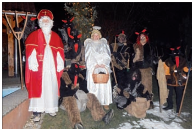
Mikuláš v Jasenné.