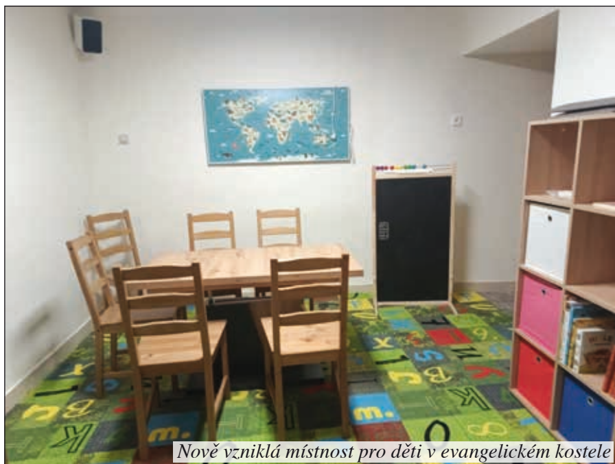
Nově vzniklá místnost pro děti v evangelickém kostele

se objeví ve vývěsce sboru). Totéž se týká i vyučování náboženství (zřejmě ve středu odpoledne – kolem 15. hodiny). A doufejme, že nám bude přát počasí v neděli 22.9.2024, kdy se má konat na naší zahradě zahrad-