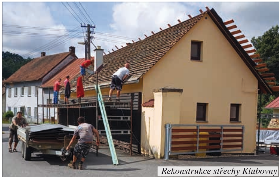
Rekonstrukce střechy Klubovny

Klubovnu ale užíváme i my k různým aktivitám. Scházejí se tu jednou za čtrnáct dní maminky s malými dětmi (zájemci jsou zváni – termíny setkání bývají vyvěšeny ve vývěsce u evangelického kostela; letos se budeme zřejmě scházet ve středu dopoledne). Během podzimu se také opět rozběhnou setkání nad Biblií (opět