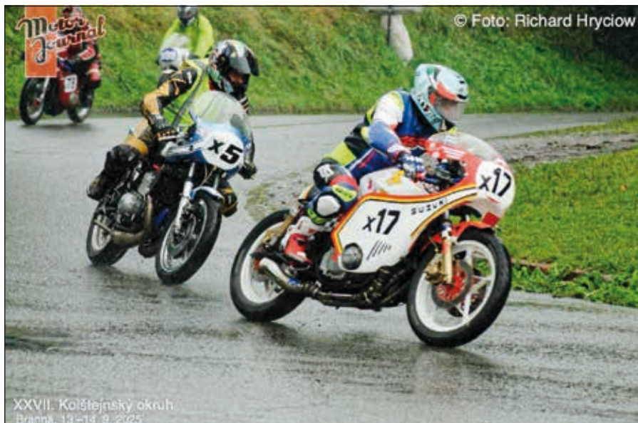
XXVII. Kolštejnský okruh Branná, 13.-14. 9. 2025