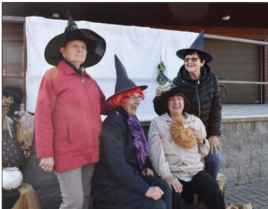
Fotokoutek: I naše starší dámy si umí ze sebe udělat legraci.